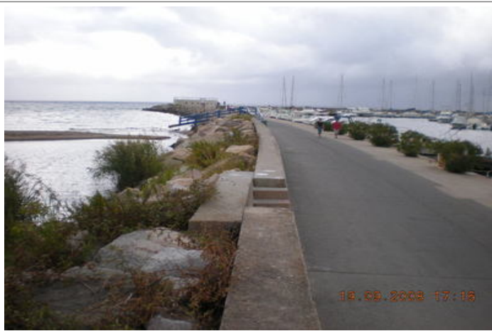
Azimut de la prise de vue : 70 gr