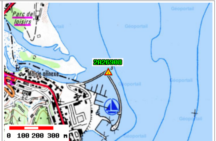
Carte : 4253 ZICAVO

Orientement : b : Repère 1996 A partir du repère a : Repère 1978