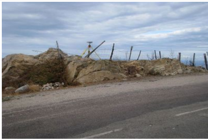
Azimut de la prise de vue : 320 gr